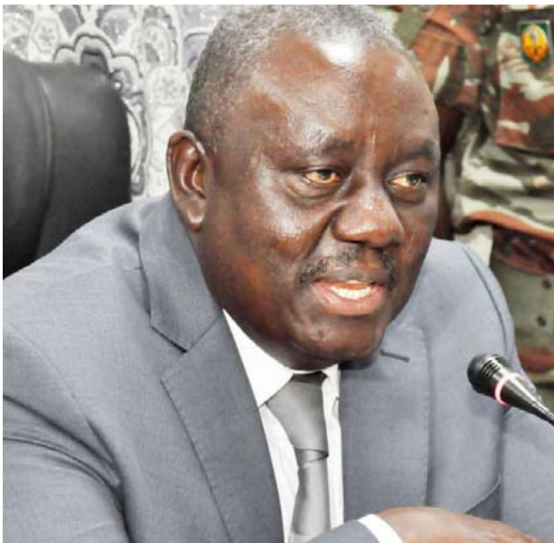
Gaston Dossouhoui, ministre en charge de l'agriculture

Le Conseil des ministres a annoncé lors de sa réunion du mercredi 17 avril 2024 un investissement majeur de près de 25 milliards de FCFA dans le secteur agricole pour la campagne 2024-2025. Cette décision s'inscrit dans la stratégie du gouvernement de soutenir activement les producteurs locaux et de renforcer l'autosuffisance alimentaire du pays.